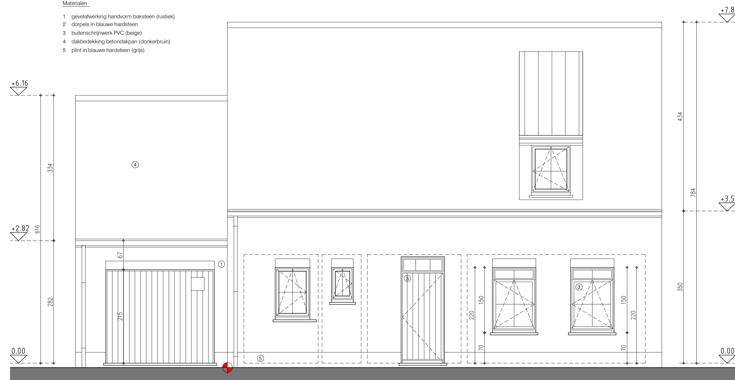
gevel zuid oost - straatgevel