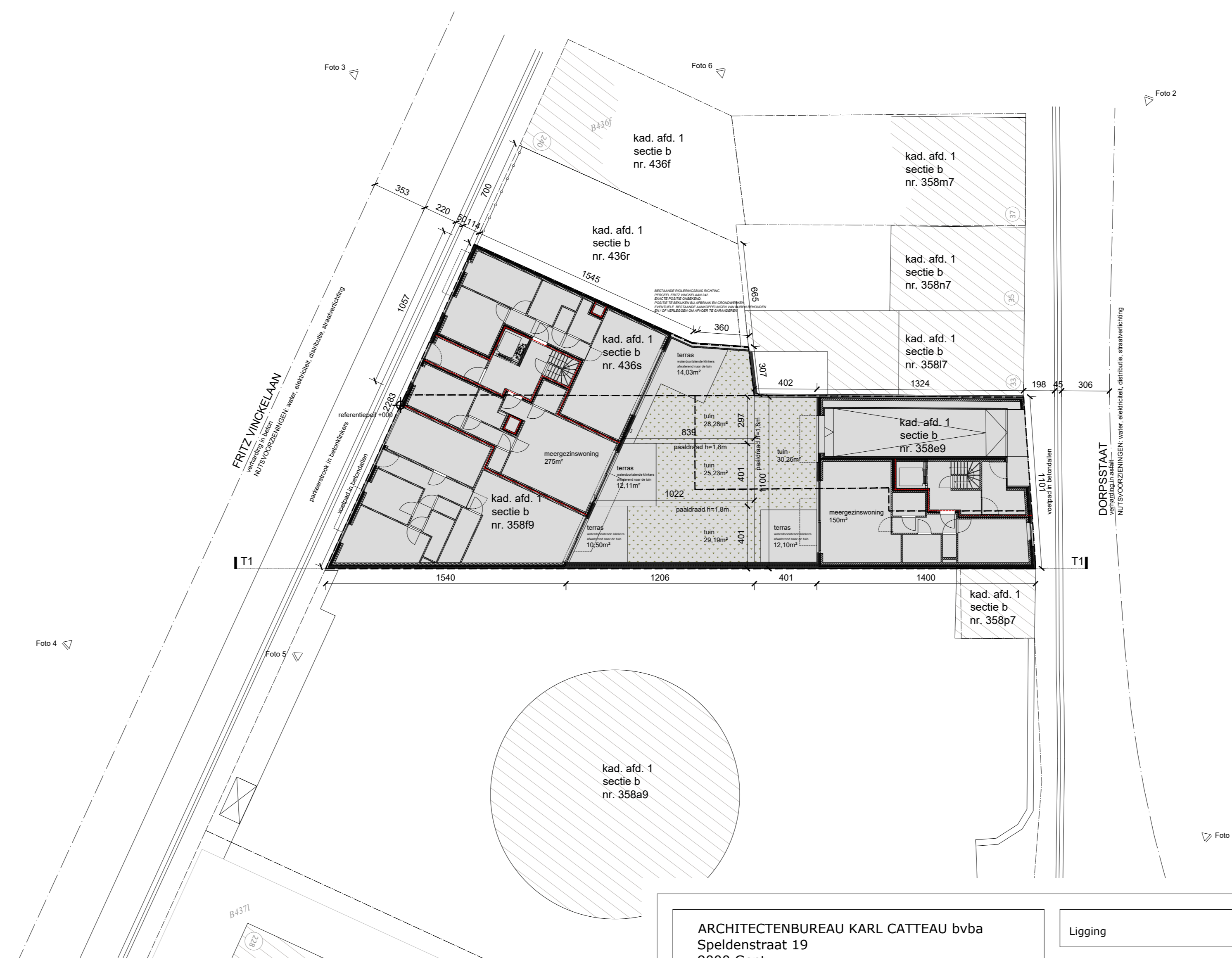
NIEUW INPLANTINGSPLAN - 1/200