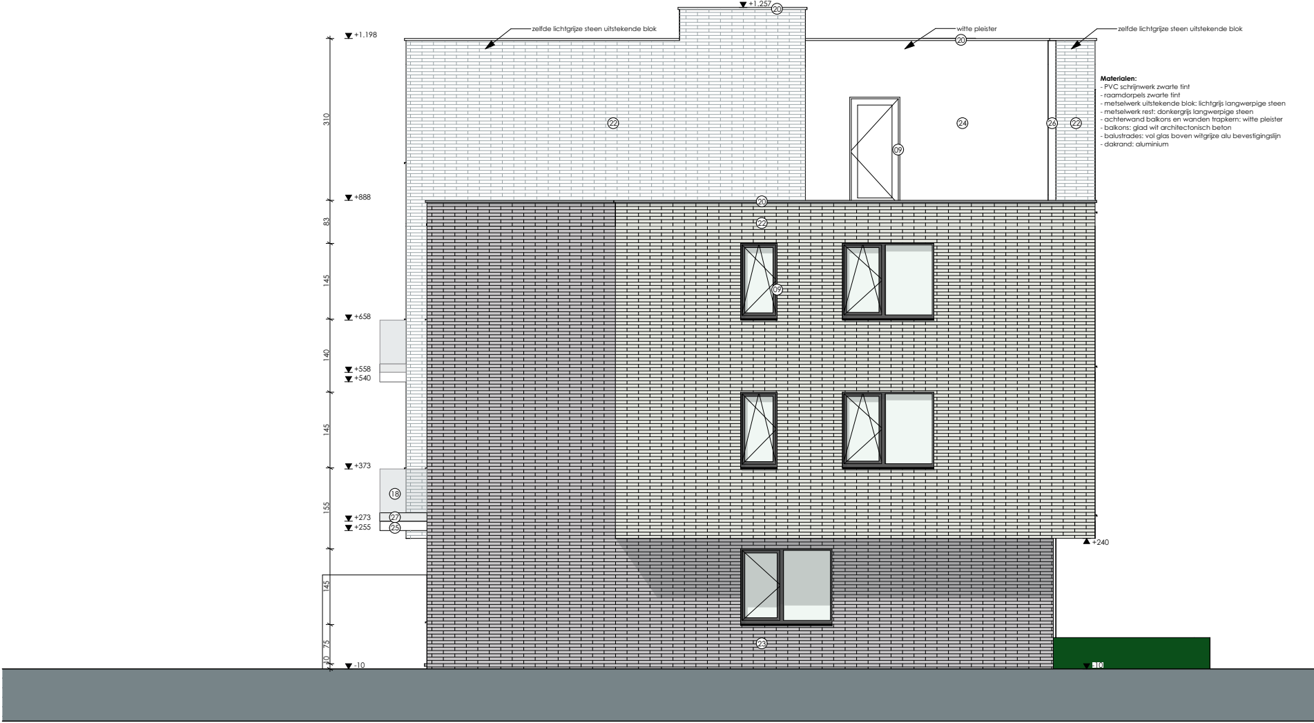
LOT15 GEVEL Noord-West