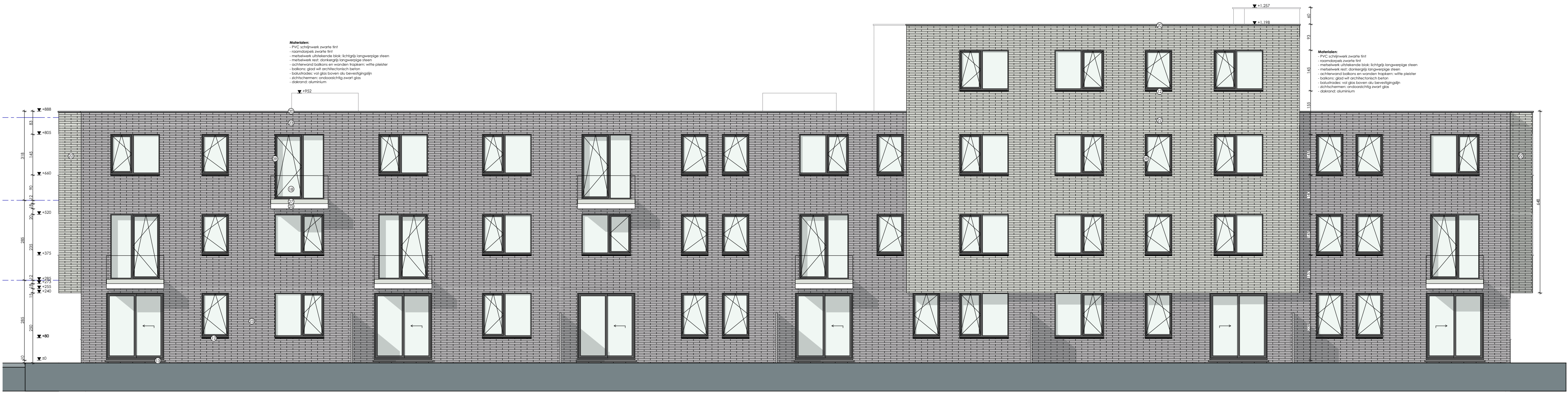
LOT15 GEVEL Noord-Oost