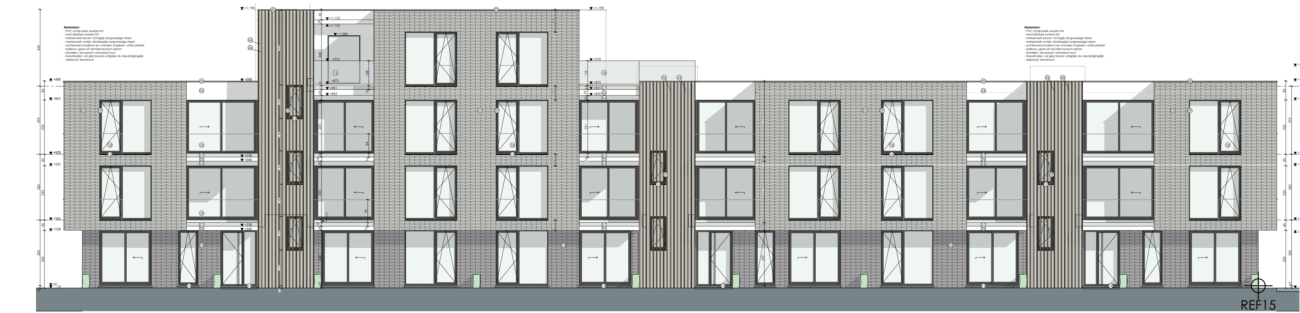
LOT 15 GEVEL Zuid-West